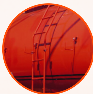
ESCADA LATERAL DE ACESSO