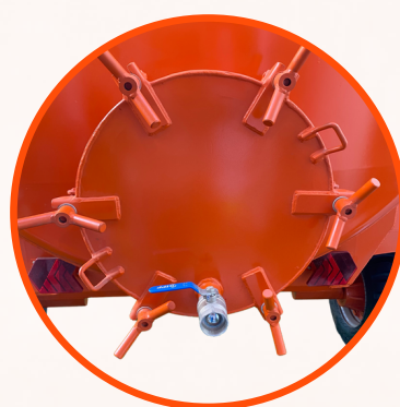
PORTA DE INSPEÇÃO DE 600MM