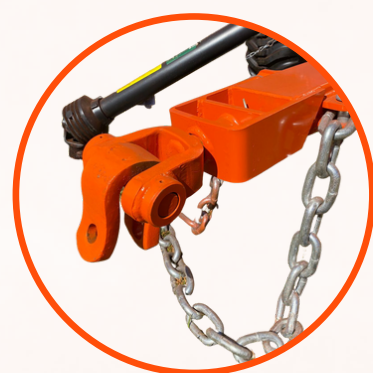
ENGATE FORJADO - MAIOR RESISTÊNCIA