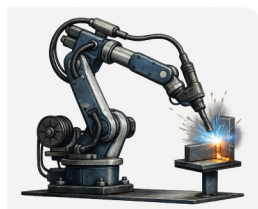
Solda a laser robotizada