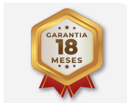
Garantia de 18 meses