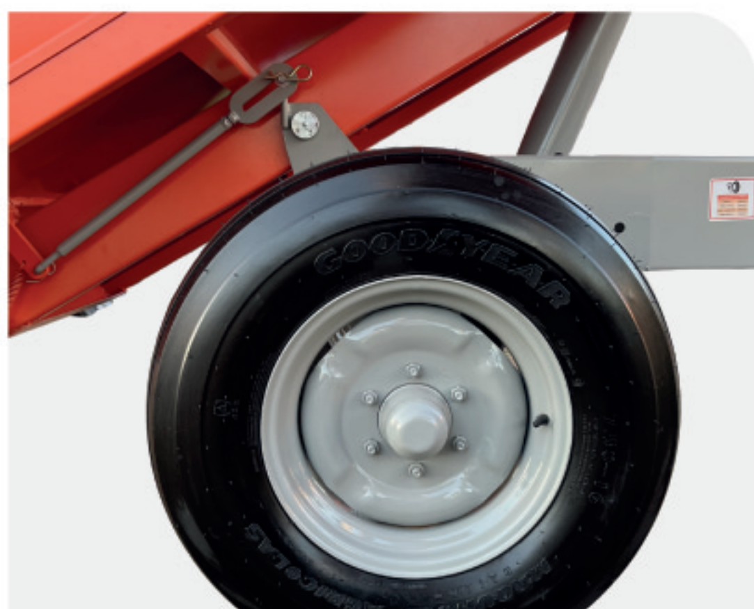
Cubos de rodas