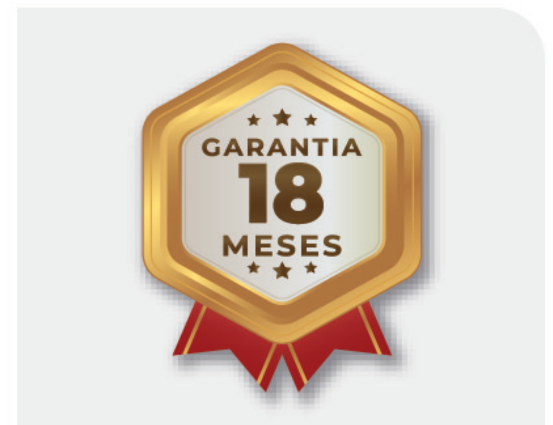
Garantia de 18 meses