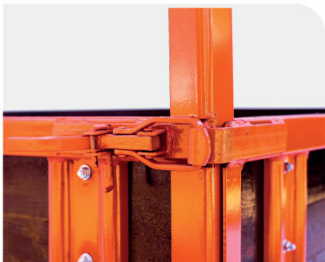
Grades com fecho rápido