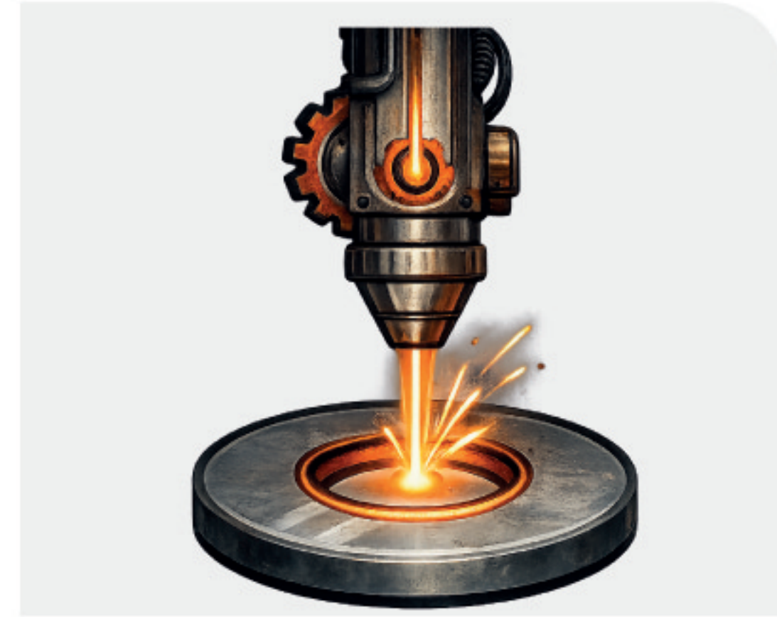
Corte a laser