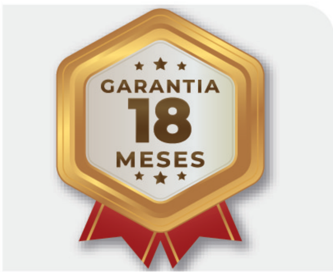
Garantia de 18 meses