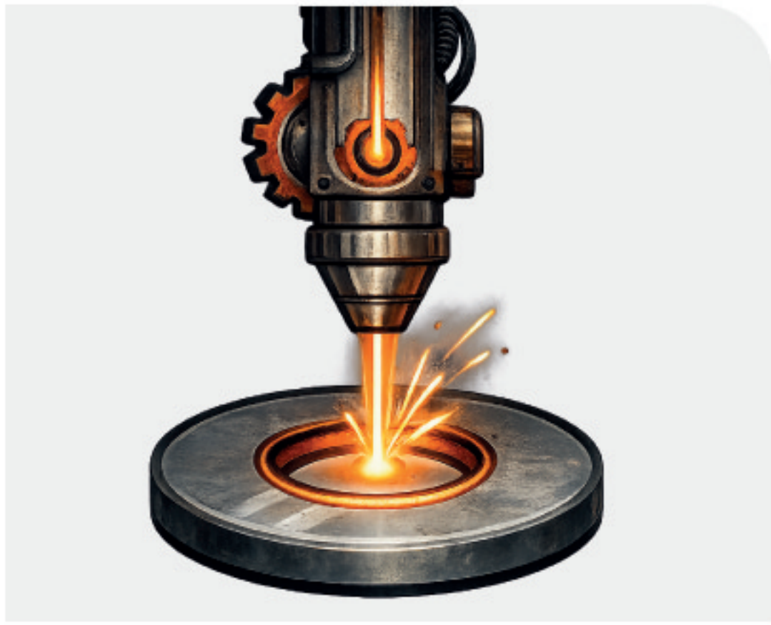
Corte a laser