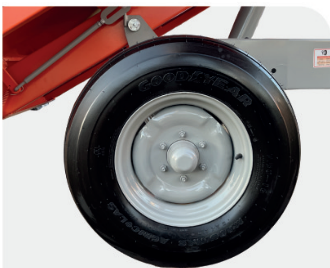
Cubos de roda com padrão automotivo