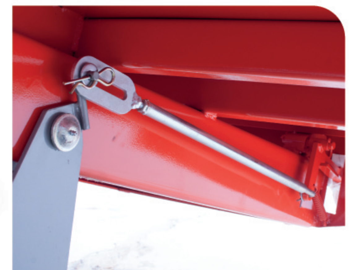
Destravar da tampa traseira por tirante de fácil regulagem